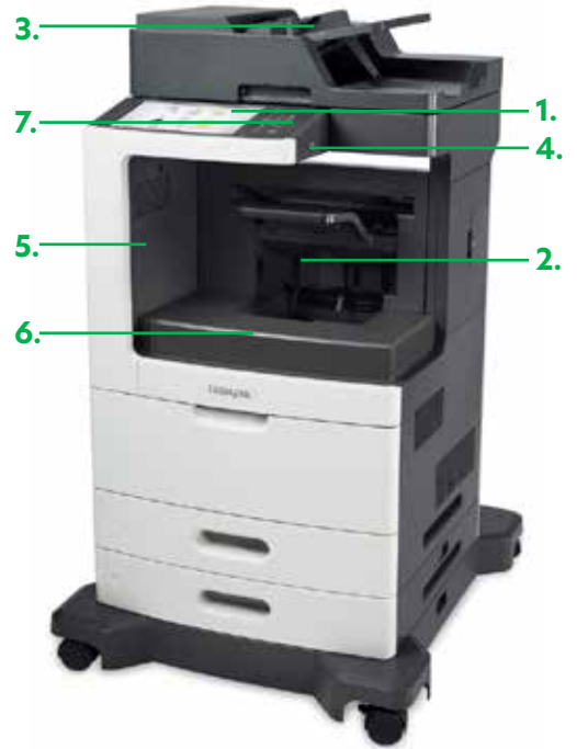
Modèle XM7170 avec unité de finition avec agrafage et perforation

Choisissez entre plusieurs options de sortie, notamment une boîte de diffusion à quatre bacs, un plateau pour séries décalées, une agrafeuse et une perforreuse.